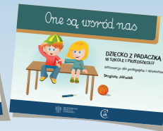
DZIECKO Z PADACZKĄ W SZKOLE I PRZEDSZKOLU